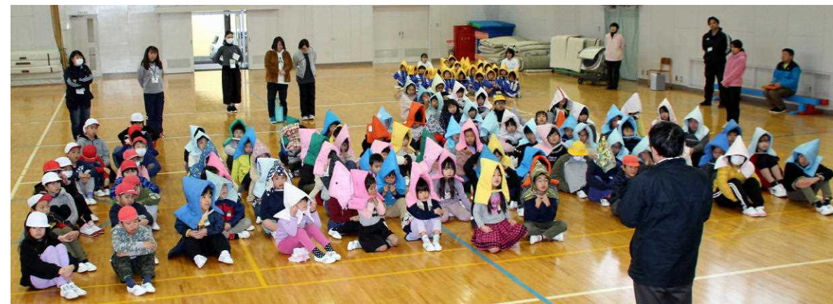
1月17日 緊急避難訓練(体育館に避難)

平成から令和にかわりました。令和の時代がどうか健やかな時代であることを願わずにはられません。