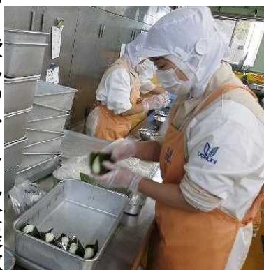
おむすびを作る調理員さん

村の学校 給食 でも、 水 や食べ物の大切さを考えてもらうために、毎年この日の前後に「 震災献立 」として、水や食料が不足していたときに主に避難所で食べられていたという「おむすび」と「豚汁」の給食が提供されています。それに合わせて給食の時に、栄養教諭が指導も行い、当時には、千早赤阪村の給食センターの大きな鍋で作った 豚汁 を神戸の 避難所 まで運んでいったという話も聞きました。